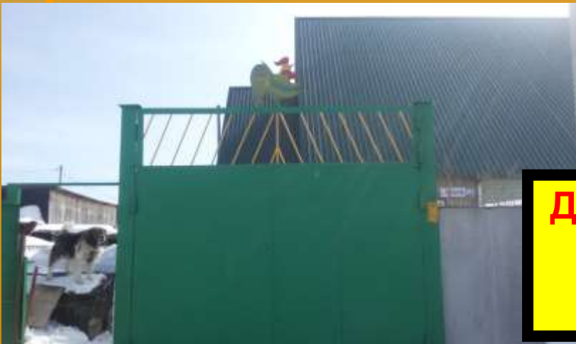
Дом с петушком на заборе по ул. Мамонтова – символ солнца и тепла.